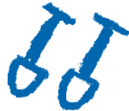
Travail possible ici